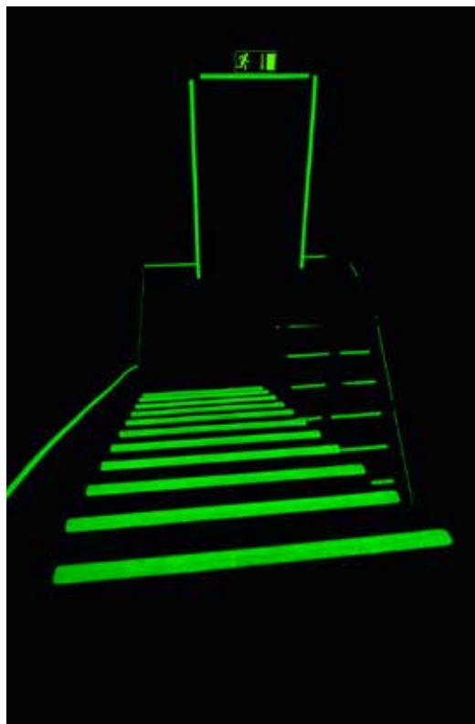
Escalier dans le noir avec 3M Safety-Walk photoluminescent