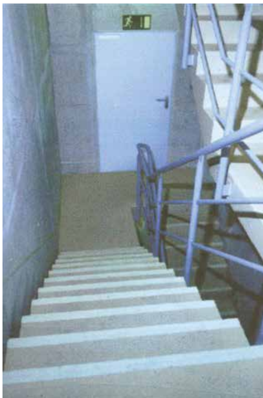
Escalier à la lumière avec 3M Safety-Walk photoluminescent