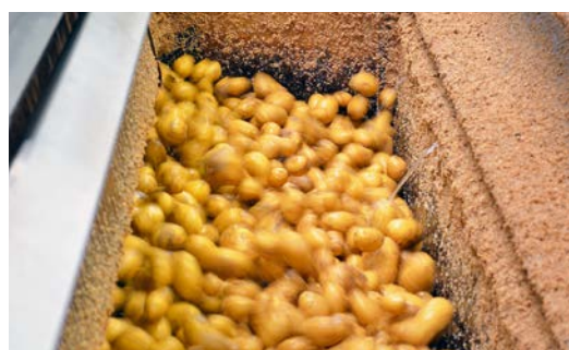
Après un bain, la pelure est évacuée.

Les avantages de travailler avec de l'abrasif sont évidents: beaucoup moins de perte de produit par rapport à un pelage aux couteaux, moins d'énergie consommée par rapport à un pelage à la vapeur.