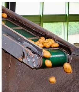
Les pommes de terre sont d'abord triées et débarrassées des cailloux.