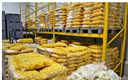
Bien emballés le produit fini est prêt pour la livraison.