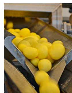
Les pommes de terre sont acheminées vers le coupage.