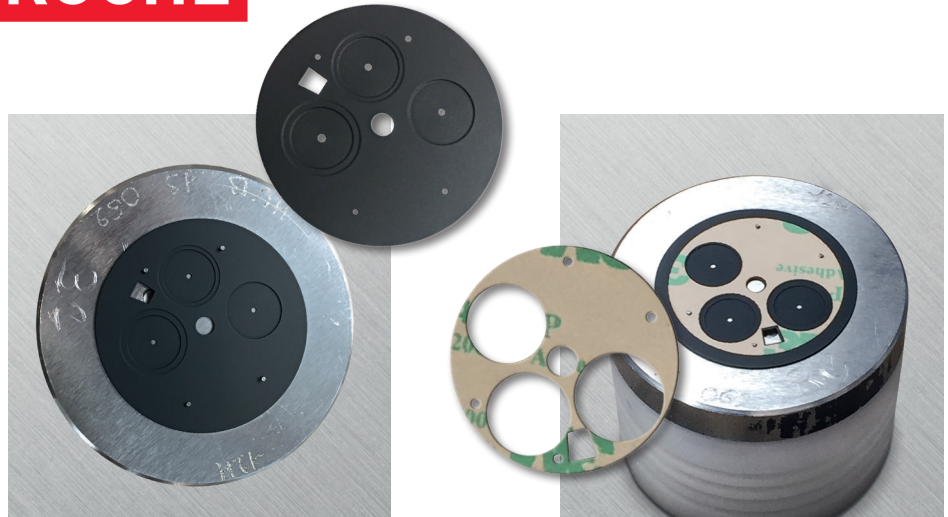
Geschwärztes Messingteil wird in die Lehre gelegt

Von der Idee bis zur Serie – dank der hauseigenen IBZ-Produktion konnten auch die Anforderungen an Sauberkeit, Genauigkeit und schneller Ausführung erfüllt werden.