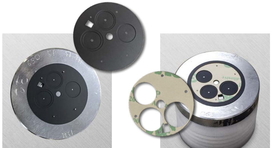
La pièce en laiton noircie est placée dans la matrice de guidage

Du projet à la production – grâce à notre production interne, les exigences en matière de propreté, de précision et d'exécution rapide peuvent être satisfaites.